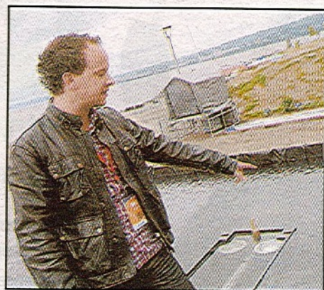
L'eau devrait aussi jouer un rôle important dans le spectacle.