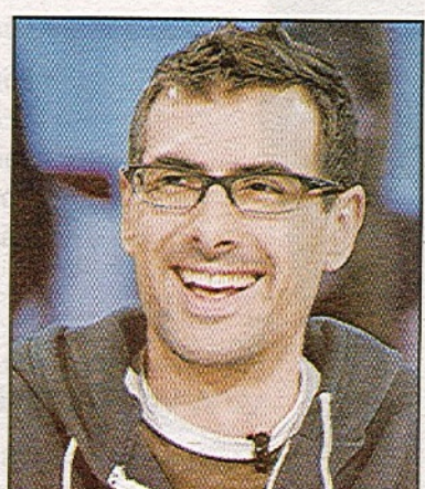
Bran Van 3000, Moby et DJ Champion réunis dans un même spectacle.